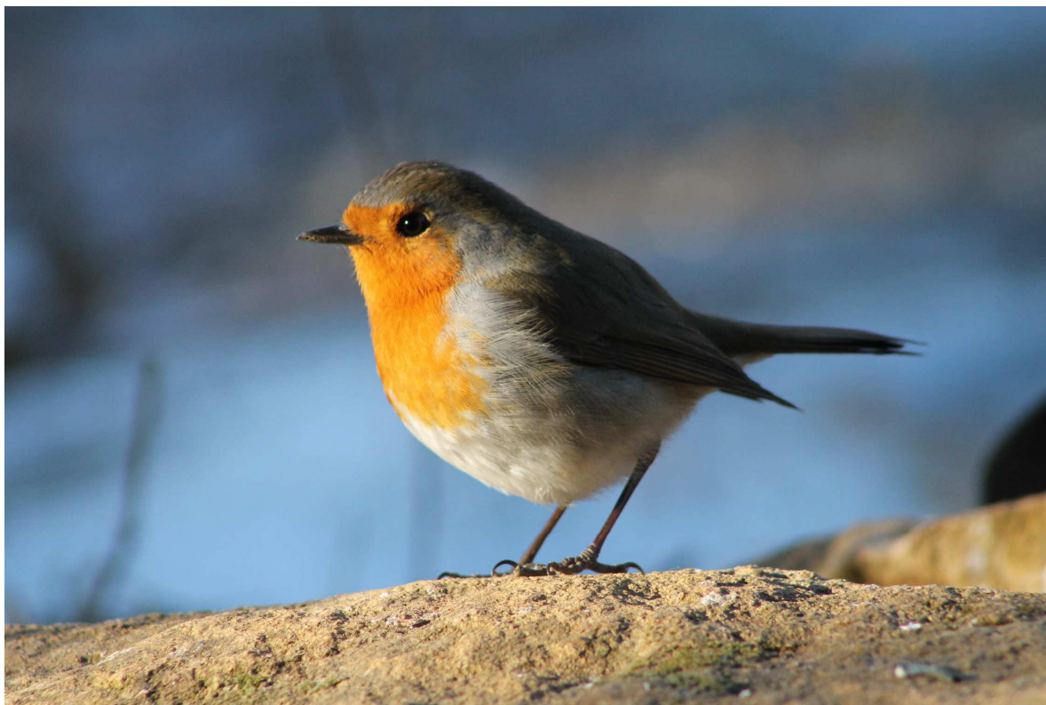
Le Rouge gorge