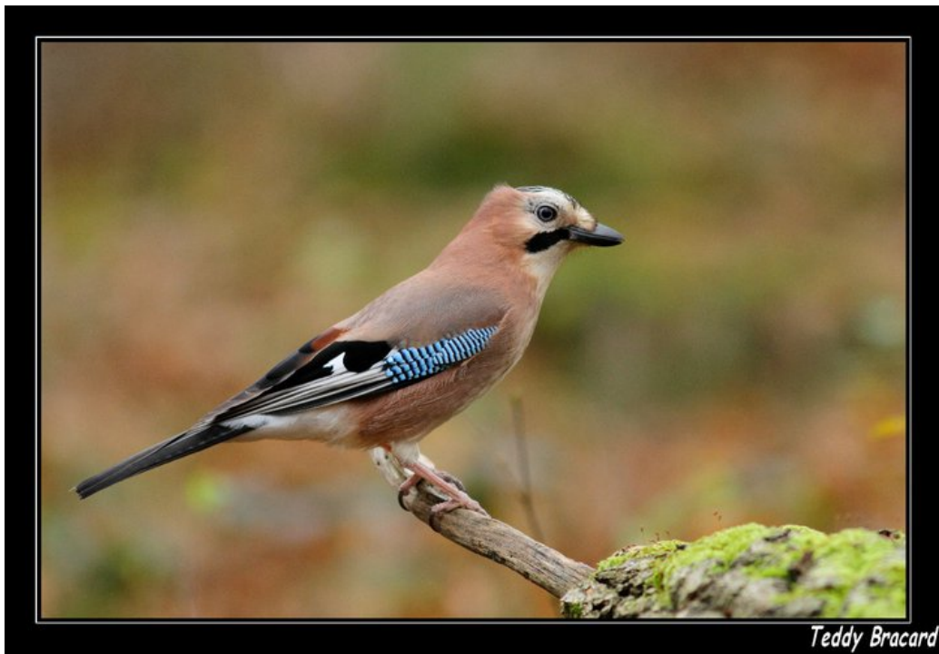
Le Geai des chênes