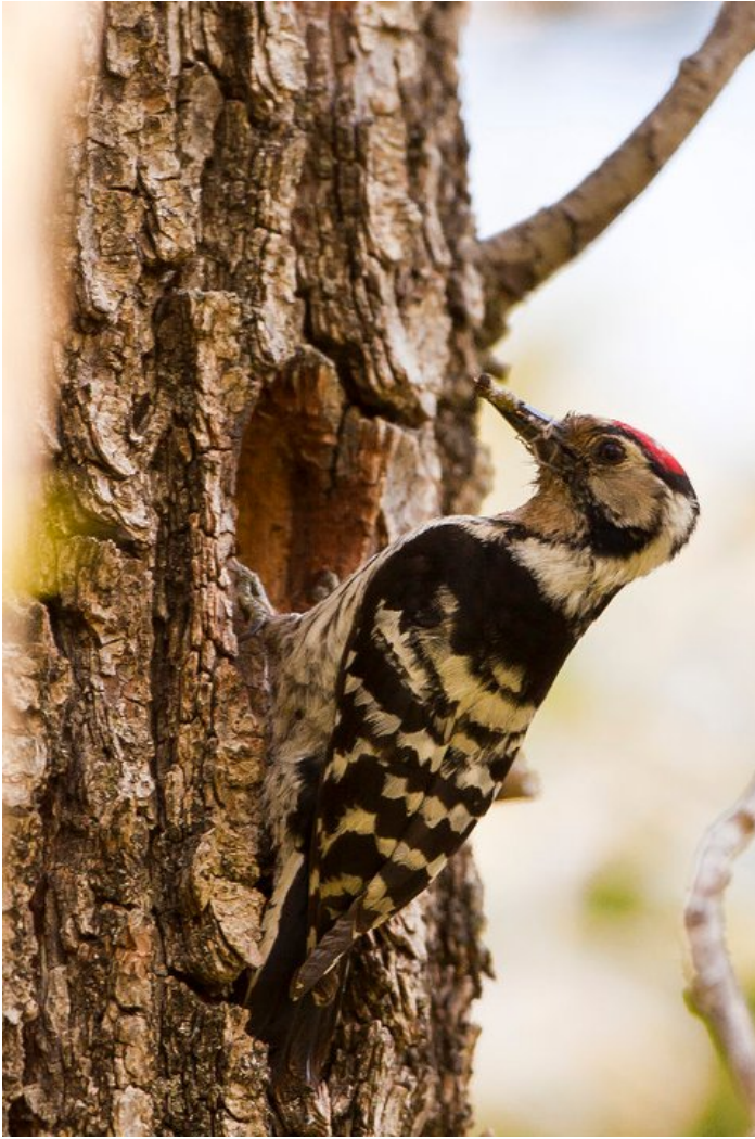
Le Pic épeichette