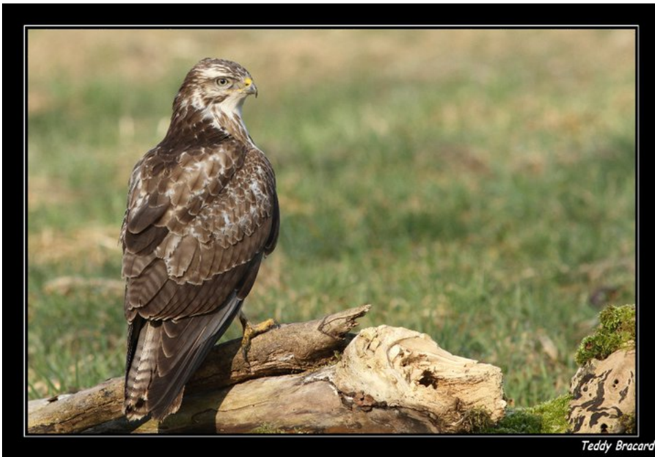
La Buse variable