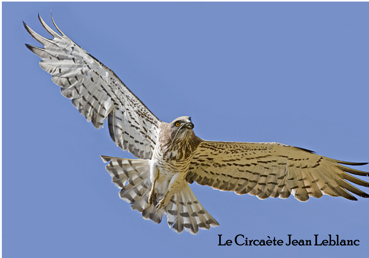
Le Circaète Jean Leblanc