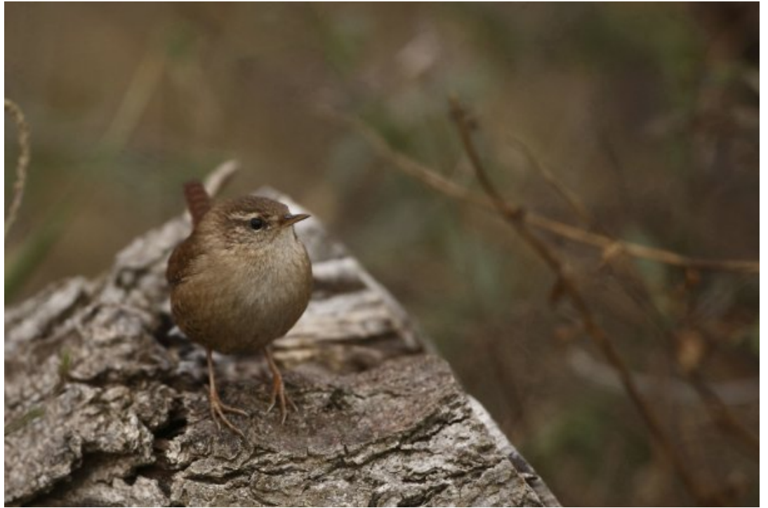
Le Troglodyte mignon Le plus petit des oiseaux de nos régions