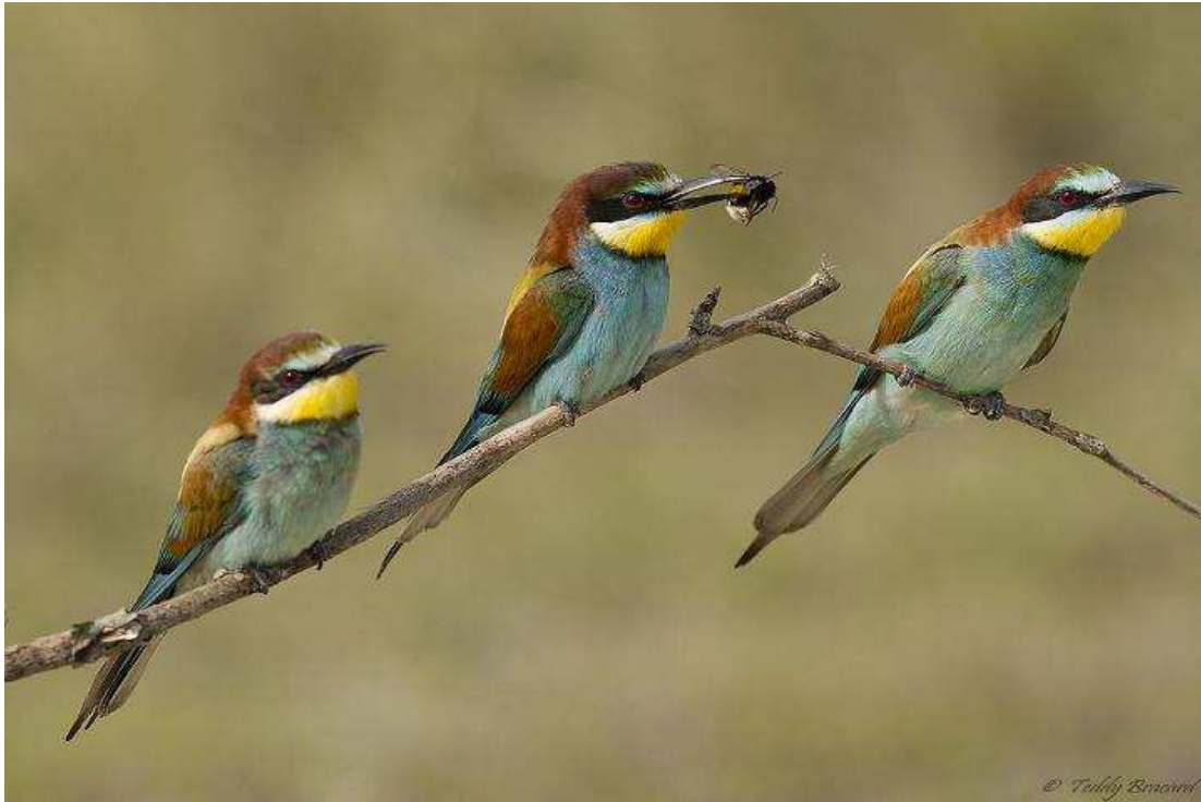
Le Guêpier d'Europe