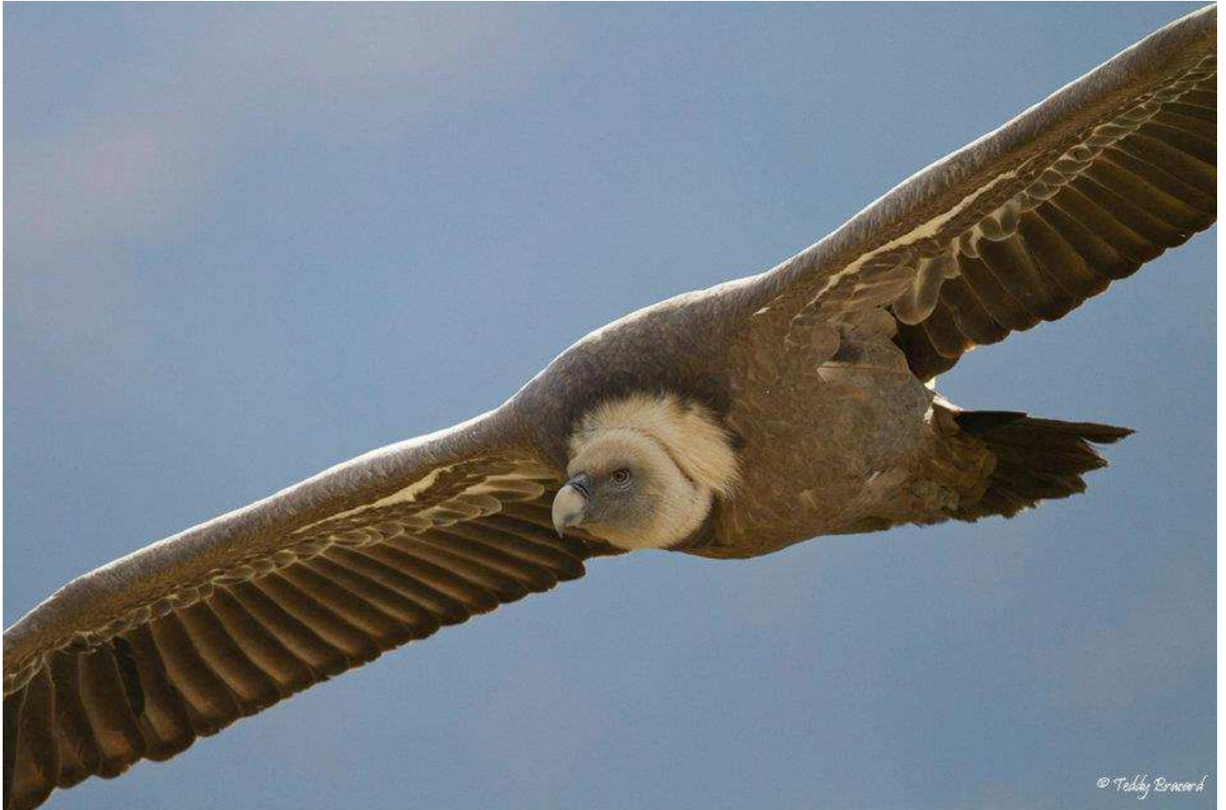
Le Vautour fauve