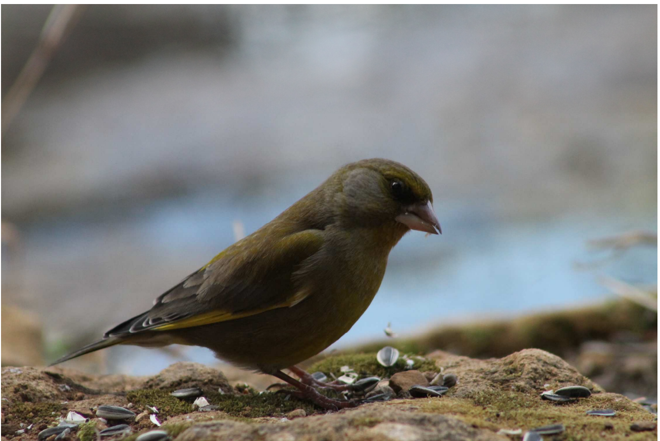
Le Verdier d'Europe