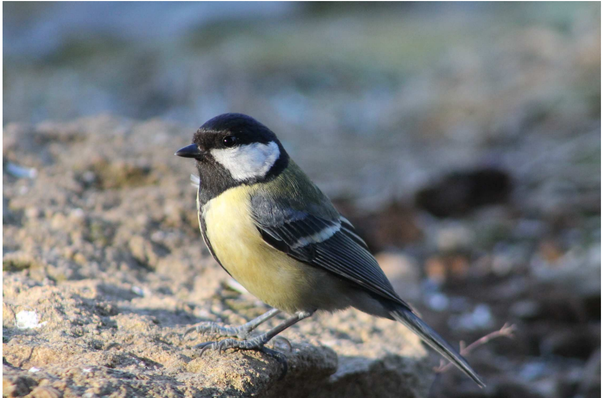
La Mésange charbonnière