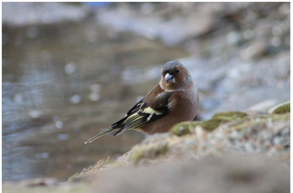
Le Pinson des arbres