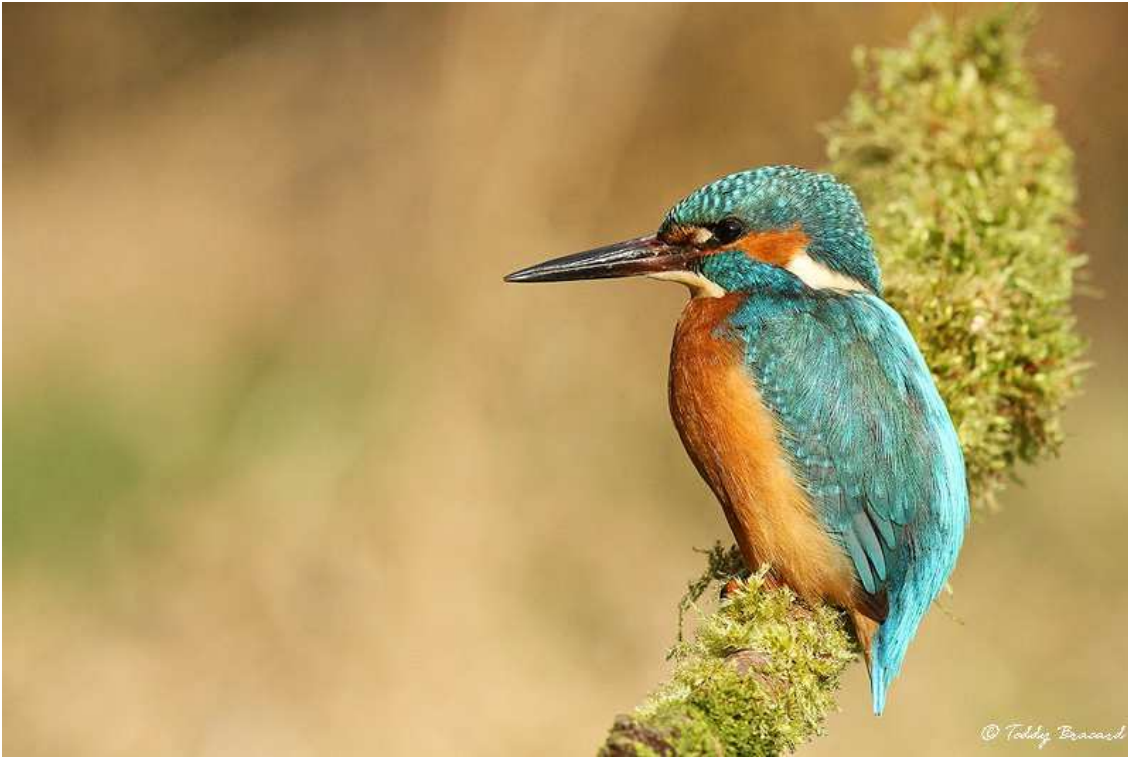
Le Martin pêcheur