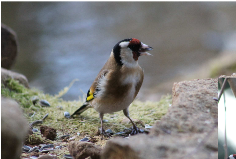
Le Chardonneret élégant