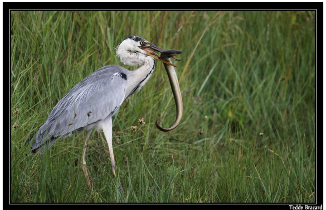
Le Héron cendré