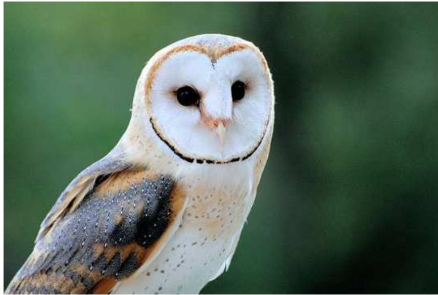
La Chouette effraie