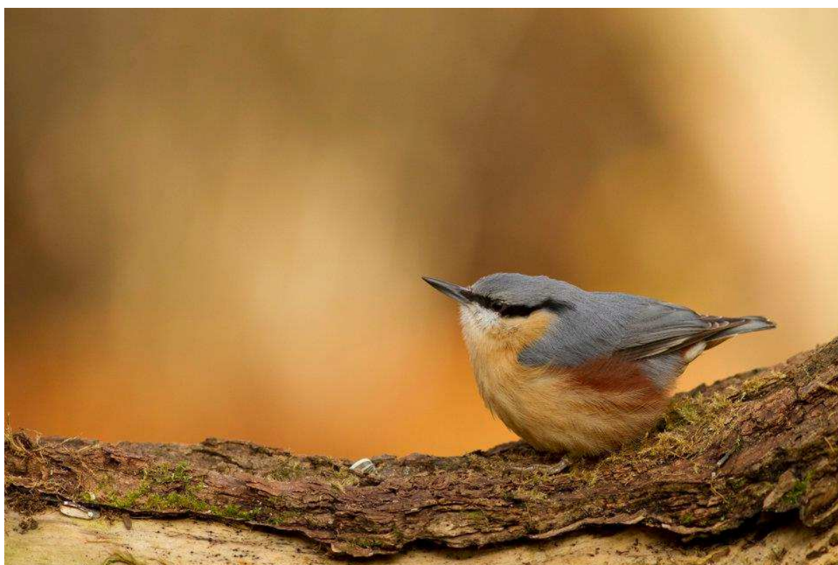
La Sittelle torchepot