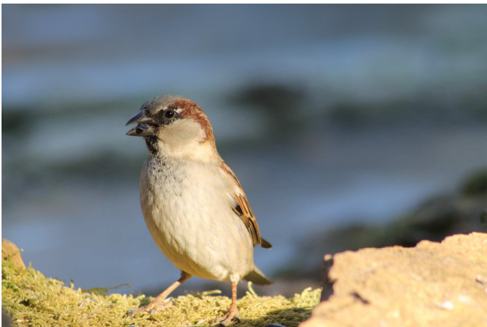
Le Moineau domestique