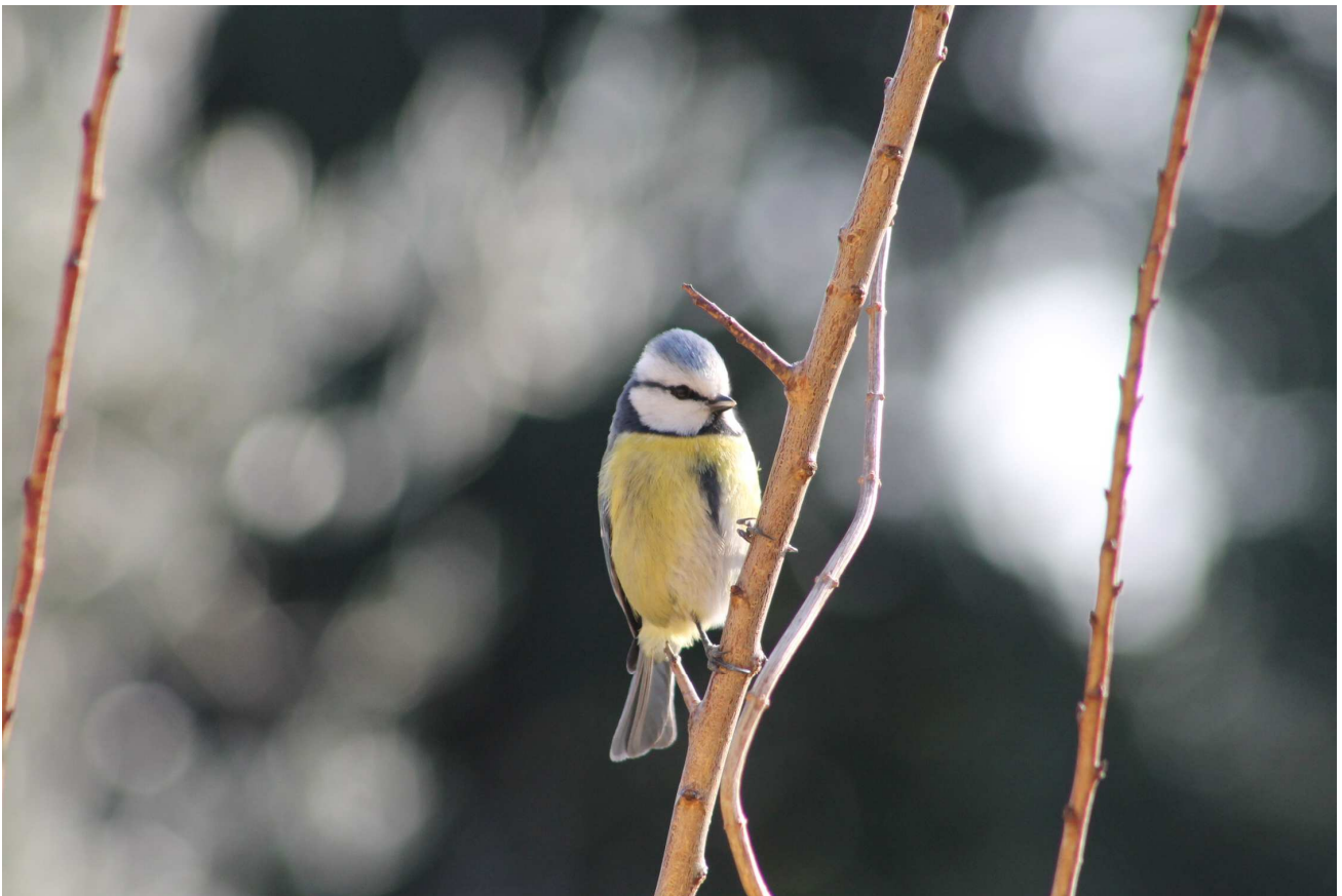
La Mésange bleue